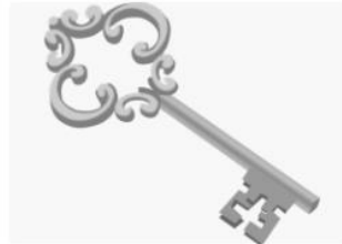
Nýr nemandi í bekknum

Upplýsingar og leiðbeiningar sem tengjast skóla- og frístundastarfi