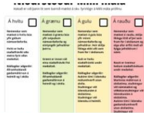
Milli mála prófið