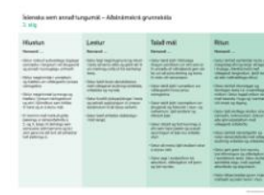
Íslenska sem annað tungumál