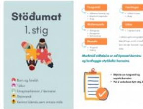
Stöðumat nýrra nemenda á Íslandi