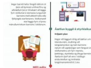
Móttaka nýrra nemenda af erlendum uppruna