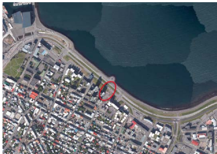
Mynd 2 Gatnamót Frakkastígs, Sæbrautar og Skúlagötu.