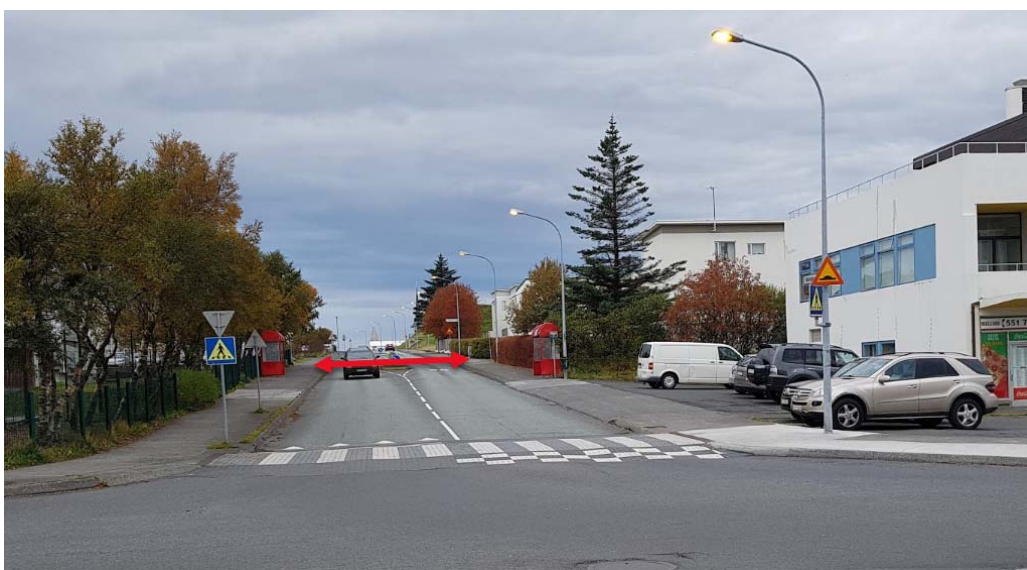
Mynd 2 Lagt er til að gönguþverun sem merkt er með rauðu verði gangbraut.