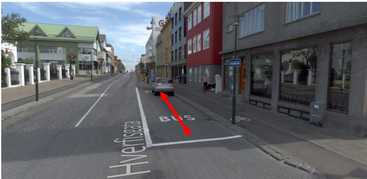
Mynd 2 Lagt er til að heimilt verði að afgreiða vörur, en annars óheimilt að stöðva og leggja, á Hverfiggötu, merkt með rauðu. ( www.ja.is )