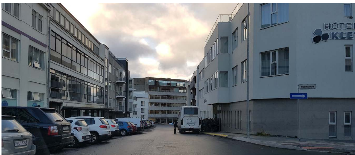
Mynd 2 Lagt er til að óheimilt verði að leggja við norðurkant Brautarholts frá Ásholti að Stórholti.