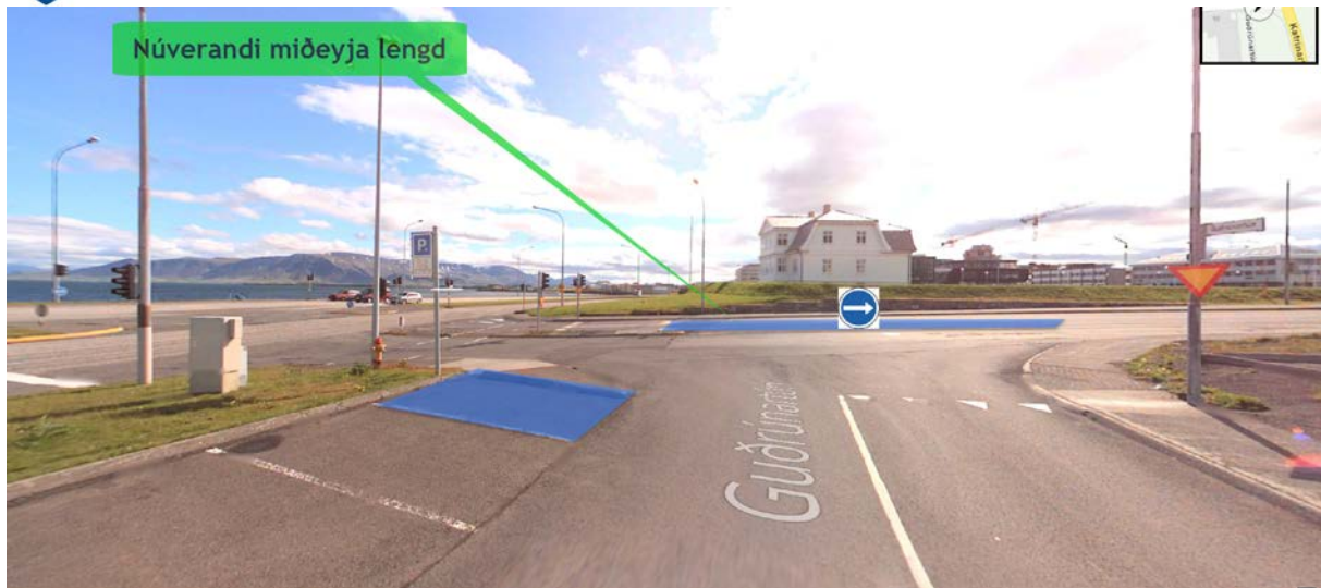
Mynd 1 Tillaga um að einungis verði heimilt að aka til hægri frá Guðrúnartúni á gatnamótum við Katrínartún (Mynd unnin á grunn frá www.ja.is )