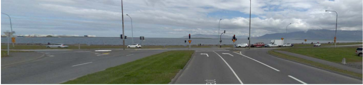
Mynd 3 Gatnamót Sæbrautar og Snorrabrautar, horft norður eftir Snorrabraut. Lagt er til að leggja niður akreinina lengst til hægri.