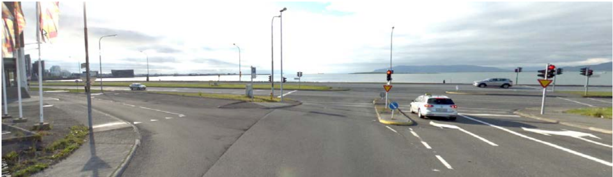
Mynd 4 Gatnamót Sæbrautar og Katrínartúns og gatnamót Katrínartúns og Guðrúnartúns, horft norður eftir Katrínartúni. Lagt er til að bæta gönguþverun yfir Guðrúnartún sem í dag er löng og nánast inni í gatnamótunum. Fella þarf niður eitt bílastæði norðan Guðrúnartúns.