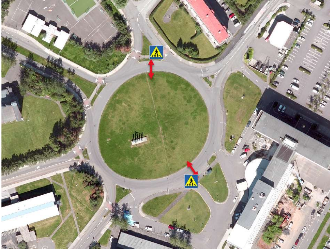
Mynd 1 Núverandi Hagatorg. Fyrirhuguð staðsetning gönguþverana sem merktar yrðu sem gangbrautir.