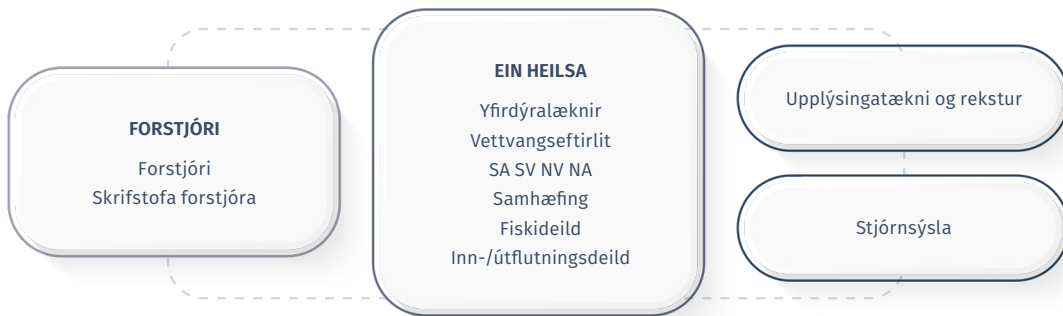
Mynd 3. Skipurit Matvælastofnunar og svæðaskipting matvælaeftirlits.

Matvælastofnun starfrækir fimm landamærastöðvar til að hafa eftirlit með innflutningi búfjárafurða, sjávarafurða og lifandi ferskvatns- og sjávardýrum, auk tiltekinna matvæla og fôðurs sem ekki eru af dýrauppruna, frá ríkjum utan Evrópska efnahagssvæðisins (EES).