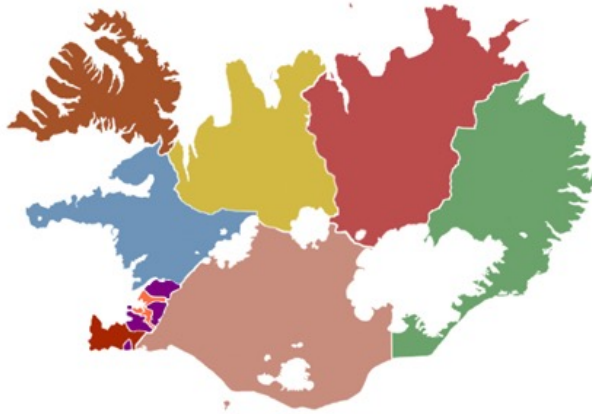
Mynd 4. Skipting níu heilbrigðiseftirlitssvæða.

legu og víðfeðmi svæðanna. Fjöldi starfsmanna ræðst af fjölda eftirlitsskyldra fyrirtækja auk annarra lögbundinna verkefna. Í gildi er reglugerð nr. 571/2002 um réttindi og skyldur heilbrigðisfulltrúa og um skilyrði fyrir að starfa sem slíkur segir í 2. gr. að viðkomandi skuli hafa háskólamenntun á sviði heilbrigðisvísinda, raunvísinda, verkfræði eða sambærilega menntun, hafa a.m.k. starfað í 6 mánuði fyrir leyfisveitingu og sótt námskeið á vegum UST til réttinda heilbrigðisfulltrúa.