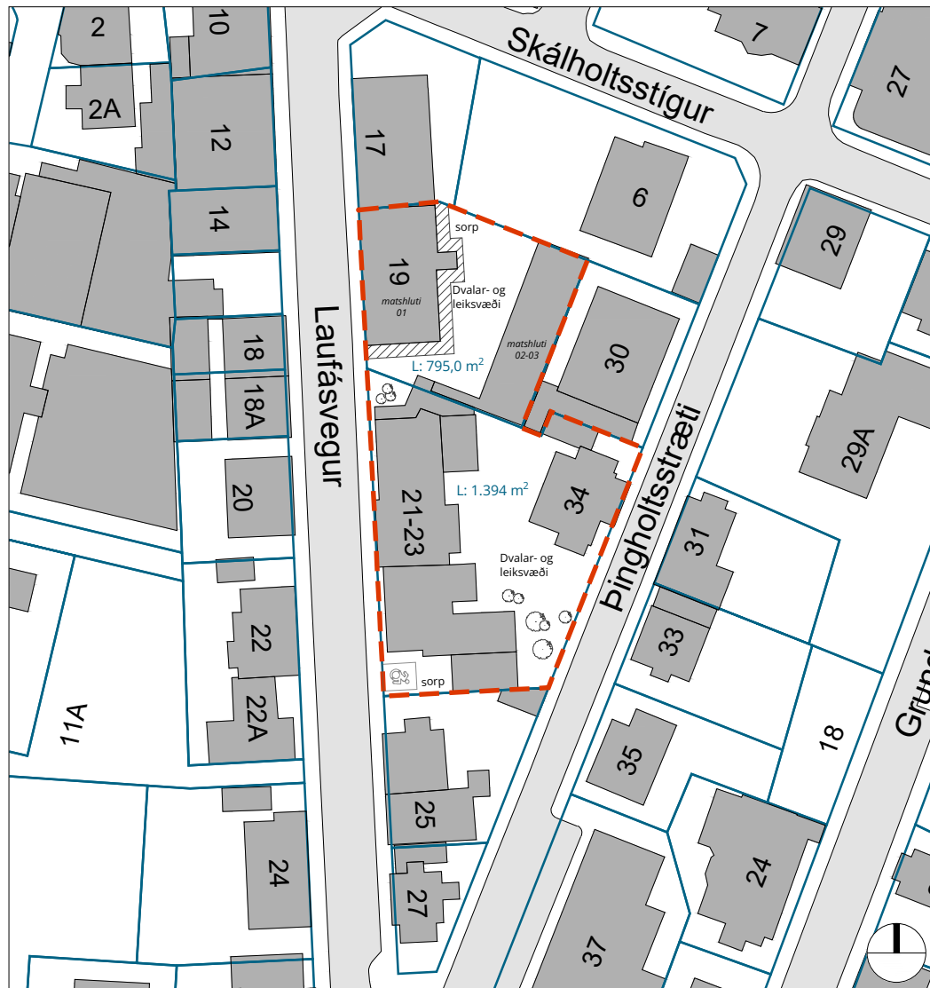
Deiliskipulag Laufásvegur 19-21-23 og Þingholtsstræti 34 í mkv. 1:1000