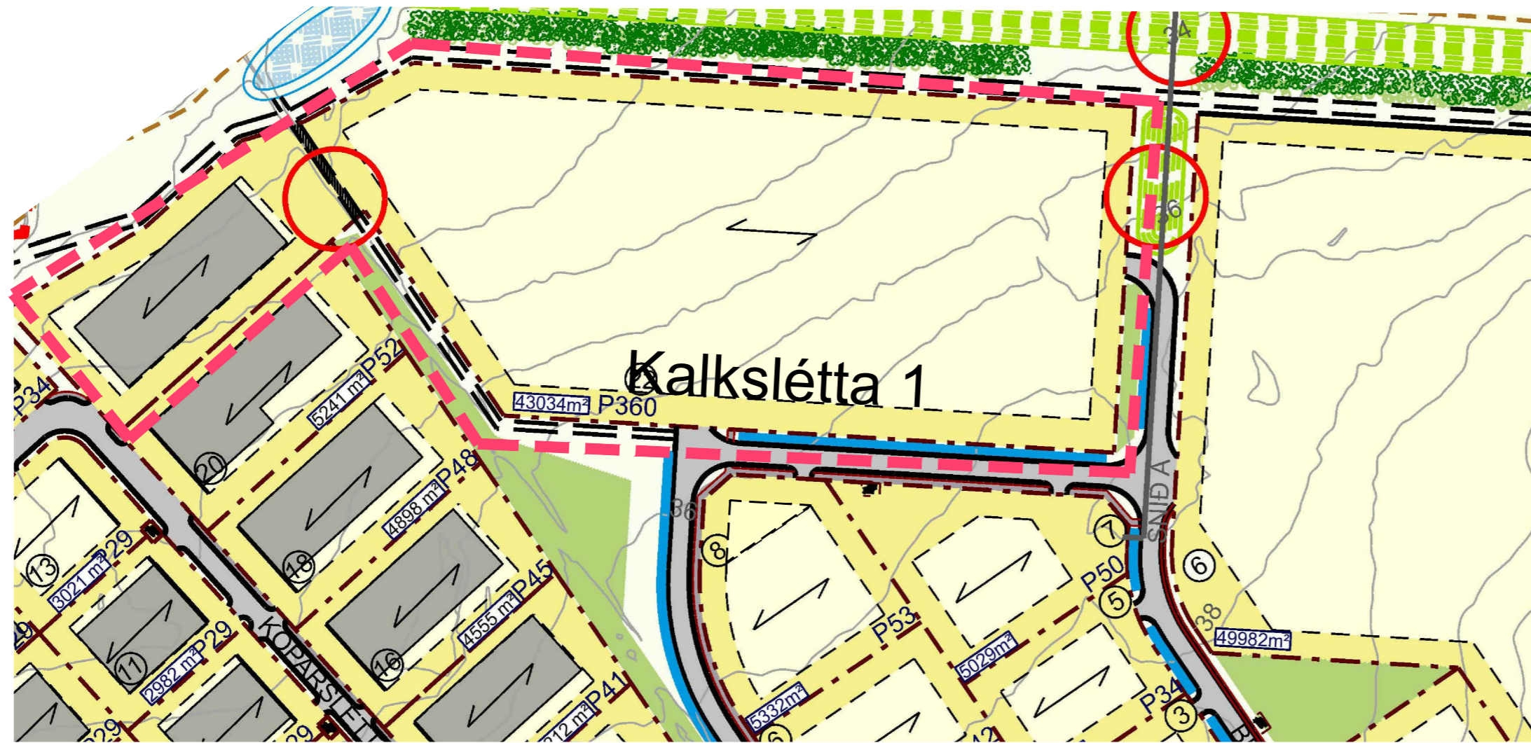
Úr gildandi deiliskipulagi frá nóvember 2021 með breytingu á Járnslettu 8 frá í febrúar 2022 mælikvarði 1:2000