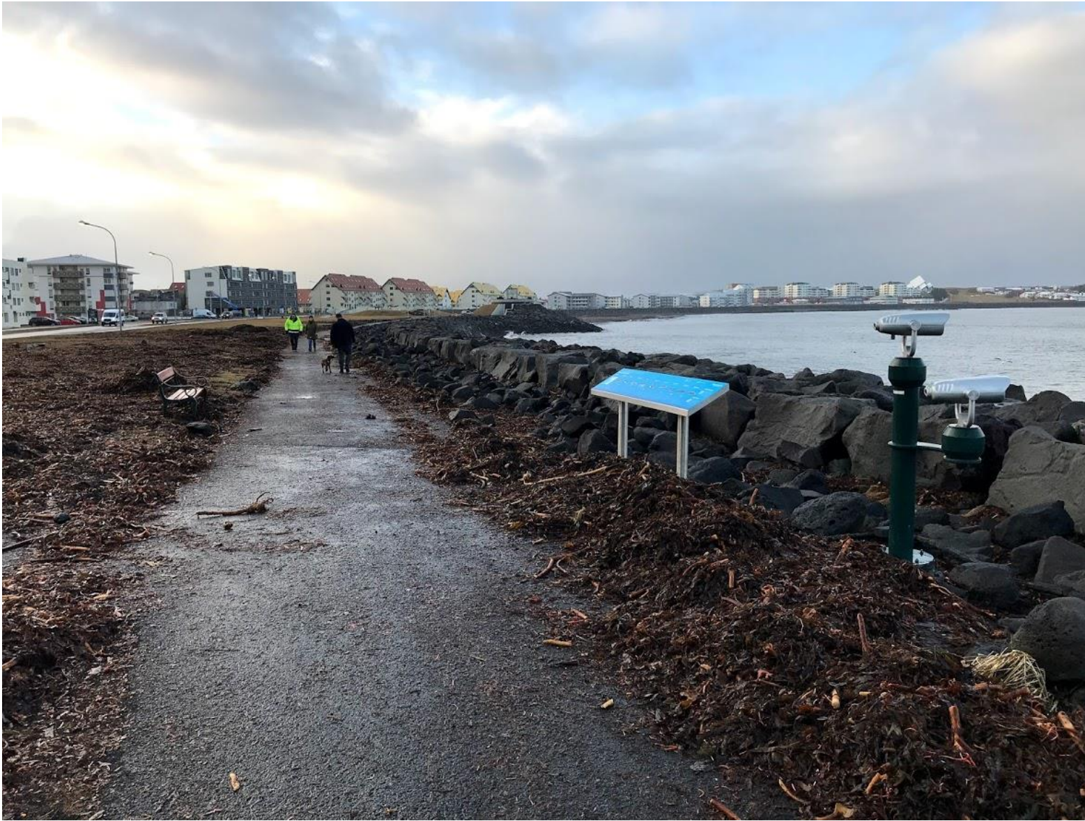
Eiðsgrandi í janúar 2020