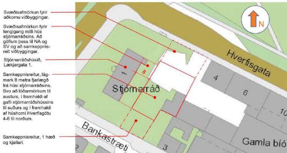
Keppnissvæðið, fylgiskjal B.

Keppnissvæðið er austan megin við Stjórnarráðshúsið við Lækjargötu 1. Það er í 8 metra fjarlægð frá austurhlíð gamla hússins og nær út að lóðarmörkum að Hverfisgötu og Bankastræti og til austurs að Hverfisgötu 4-6, Hverfisgötu 4a og 6a og Bankastræti 3, sjá mynd í fylgiskjali B Samkeppnisreitur, afmörkun .