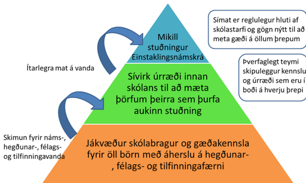
Mynd 1: Þrepaskiptur stuðningur í skólastarfi