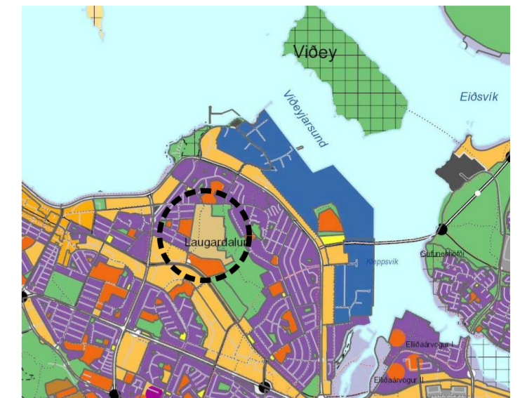
HLUTI AÐALSKIPULAGS REYKJAVÍKUR 2010-2030 STADSETNING SKIPULAGSSVÆÐIS