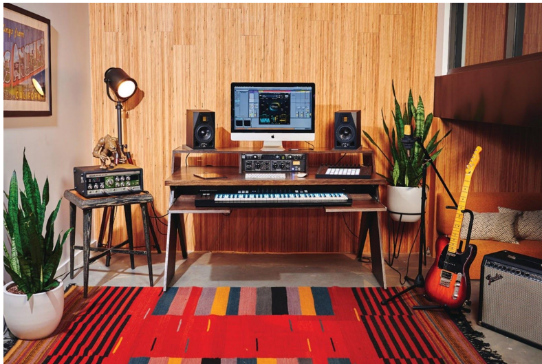
Mynd 1: Upptökurýmin

Hugmyndin er sú að hafa upptökurýmin einföld og snyrtileg með þeim búnaði sem þarf til að taka upp tónlist í góðum gæðum. Með því að leggja alúð í rýmin og hafa þau flott er verið að bjóða upp á aðstöðu sem þú færð ekki heima hjá þér. Strangar umgengnisreglur væru í rýminu og væru þátttakendur hvattir til að ganga vel um í hvívetna. Um væri að ræða nokkur svona herbergi og þá mögulega eitt herbergi sem væri svokallað A stúdío sem væri stærra. Hér fyrir ofan má sjá dæmi um snyrtilega upptökuaðstöðu þar sem einnig er hægt að semja tónlist beint í tölvunni.