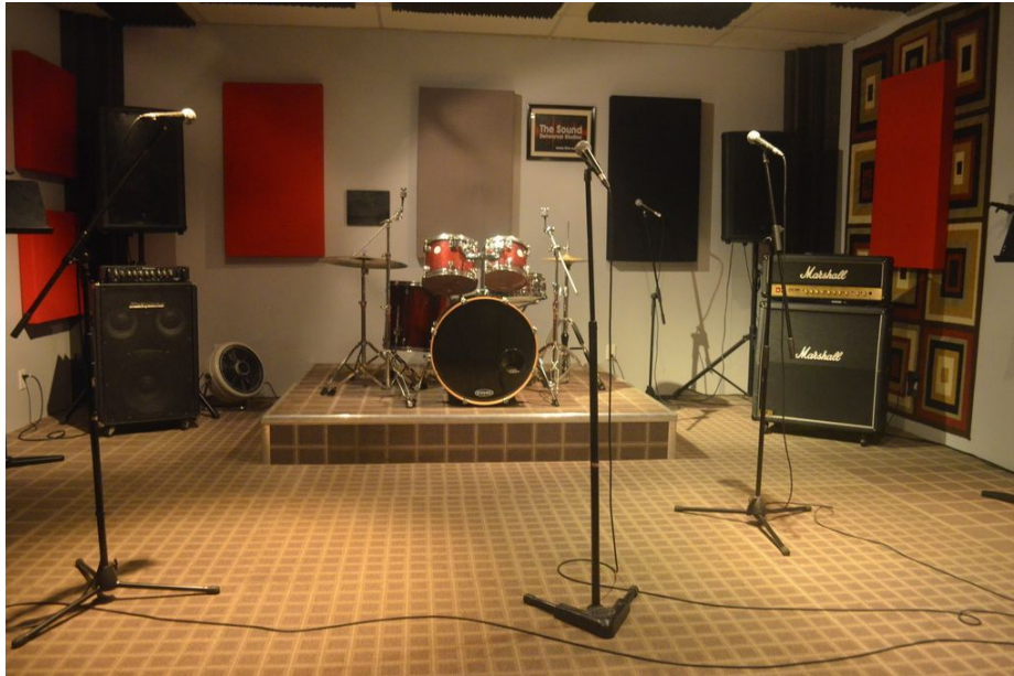
Mynd 2: Æfingarými

Æfingarýmin væru einnig snyrtilæg og flott. Þar væri leitast við að hanna rýmin þannig að hljómburður væri góður ásamt því að hafa fyrsta flokks búnað sem myndi þola mikla notkun. Þar væru einnig strangar reglur og væri mikilvægt að ganga vel um. Öll rýmin væru með eins búnaði en möguleiki væri einnig að bjóða upp á eitt stærra rými fyrir stærri hljómsveitir. Hér fyrir ofan á mynd 2 má sjá dæmi um æfingarými.