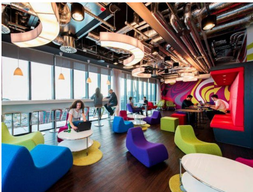
Mynd 3: Félagsaðstaðan

Tónlist sameinar fólk og í félagsaðstöðunni gætu einstaklingar hisst og borið saman bækur sínar. Þar væri einnig hægt að halda opin námskeið fyrir meðlimi félagsins ásamt því að halda litla tónleika. Lagt væri upp með að hafa aðstöðuna lifandi og flotta og tengja hana við tónlist á sem fjölbreyttasta máta. Myndir á veggjum og fleira sem myndi veita meðlimum innblástur. Þarna væri líka fundarherbergi þar sem nefndir félagsins gætu fundað.