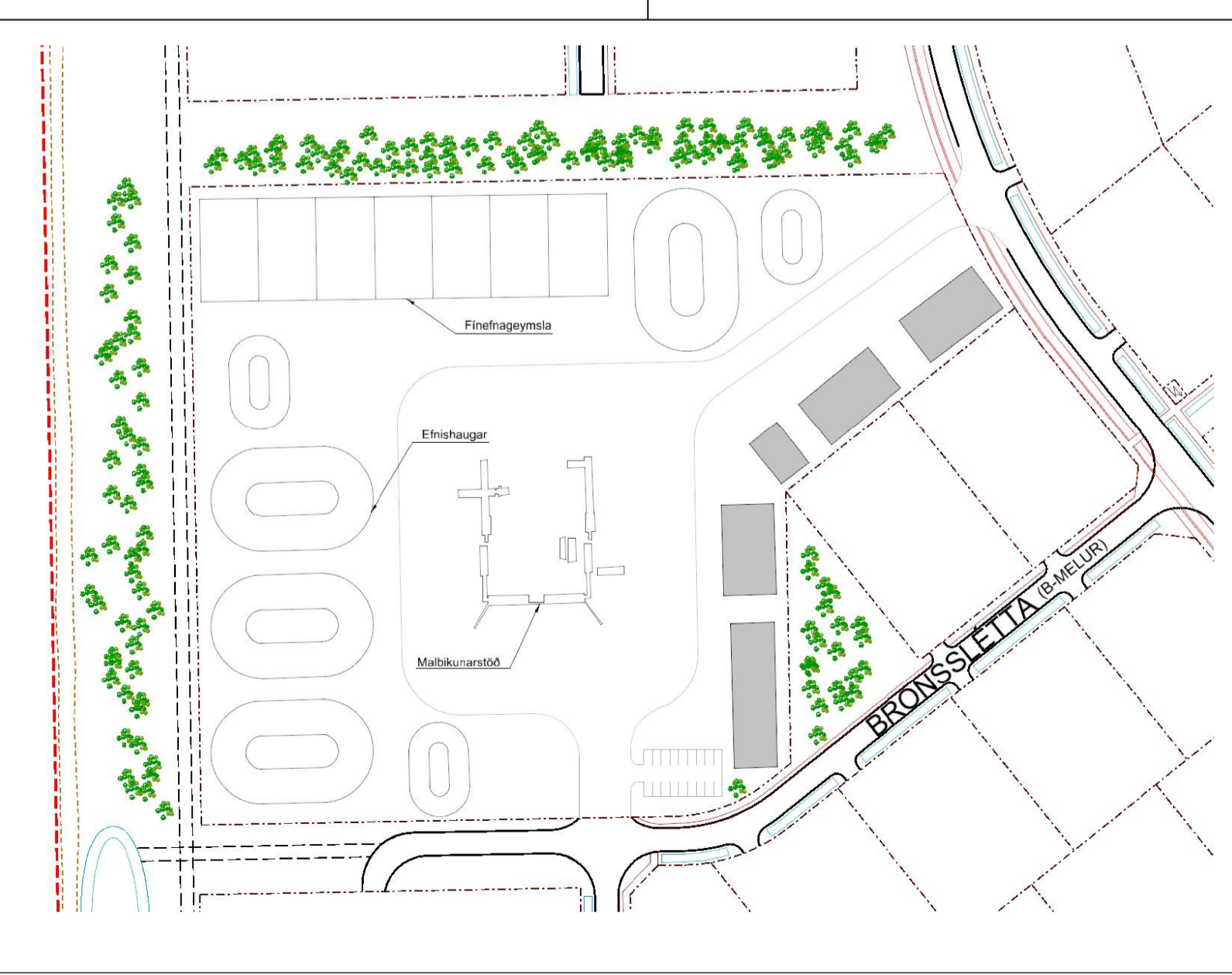
Skýringarmynd um mögulegt innra fyrirkomulag lóðar

Umhverfisáhrif breytingarinnar þar sem heimildir eru rýmið á einni lóð eru á þá lóð að möguleg neikvæð áhrif munu verða á lýðheilsu, sýnd, fráveit og loft. Neikvæð áhrif á lýðheilsu og loft staft af mögulegri loft- og hjódæmisni frá svæðinu við vísar aðbætur. Möguleg mengun vegna frásersmál frá svæðinu þar sem um ræðir er á þá lóð er því líklegt að fráveita fari í lókað kerfi en tengist ekki blágrænum ofanvatnslausum innan svæðisins. Að teknu tilliti til mótvæðingargæða, þar sem neikvæð áhrif eru lágmarkið, hefur breytingin í heiti síni óveruleg áhrif á umhverfið.