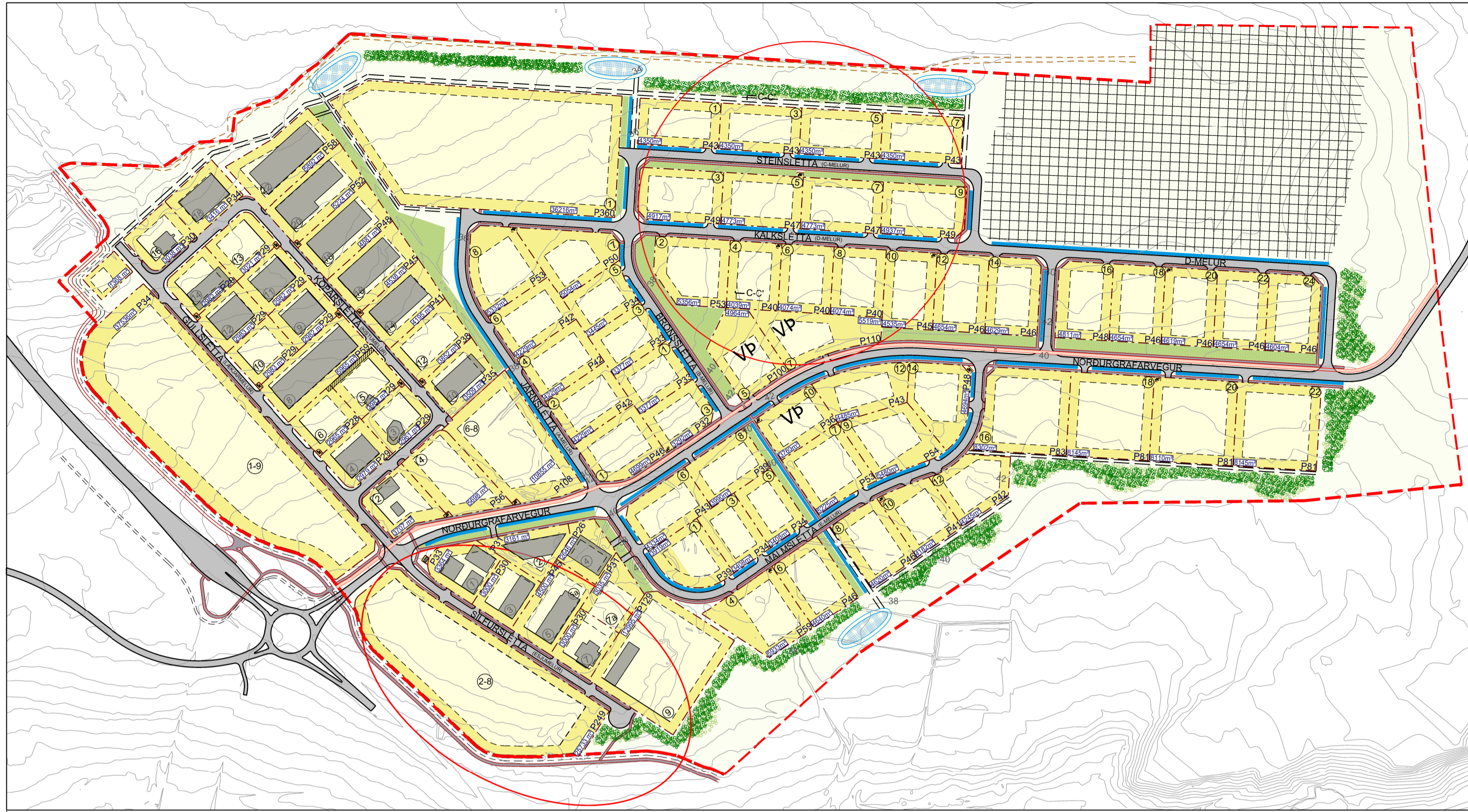
Gildandi deiliskipulag - Athafnasvæði Esmjela og Varmidalur. Mkv. 1:4000