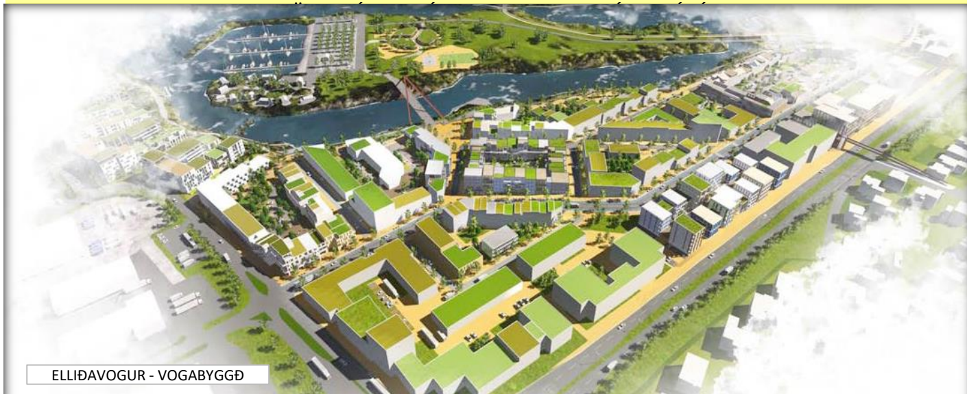
ELLIÐAVOGUR - VOGABYGGÐ

VERKSTÖÐUSKÝRSLA NÝFRAMKVÆMDA JANÚAR - SEPTEMBER 2018