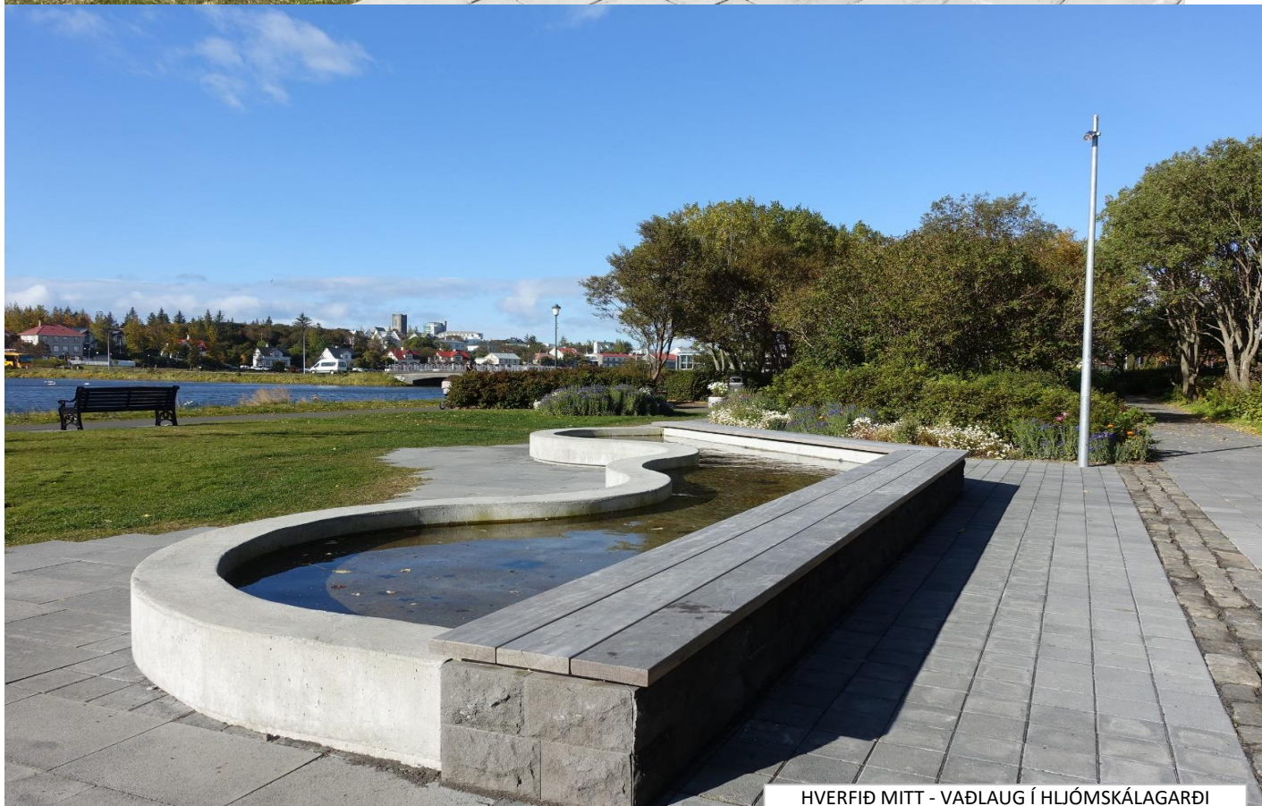
HVERFIÐ MITT - VAÐLAUG Í HLJÓMSKÁLAGARÐI