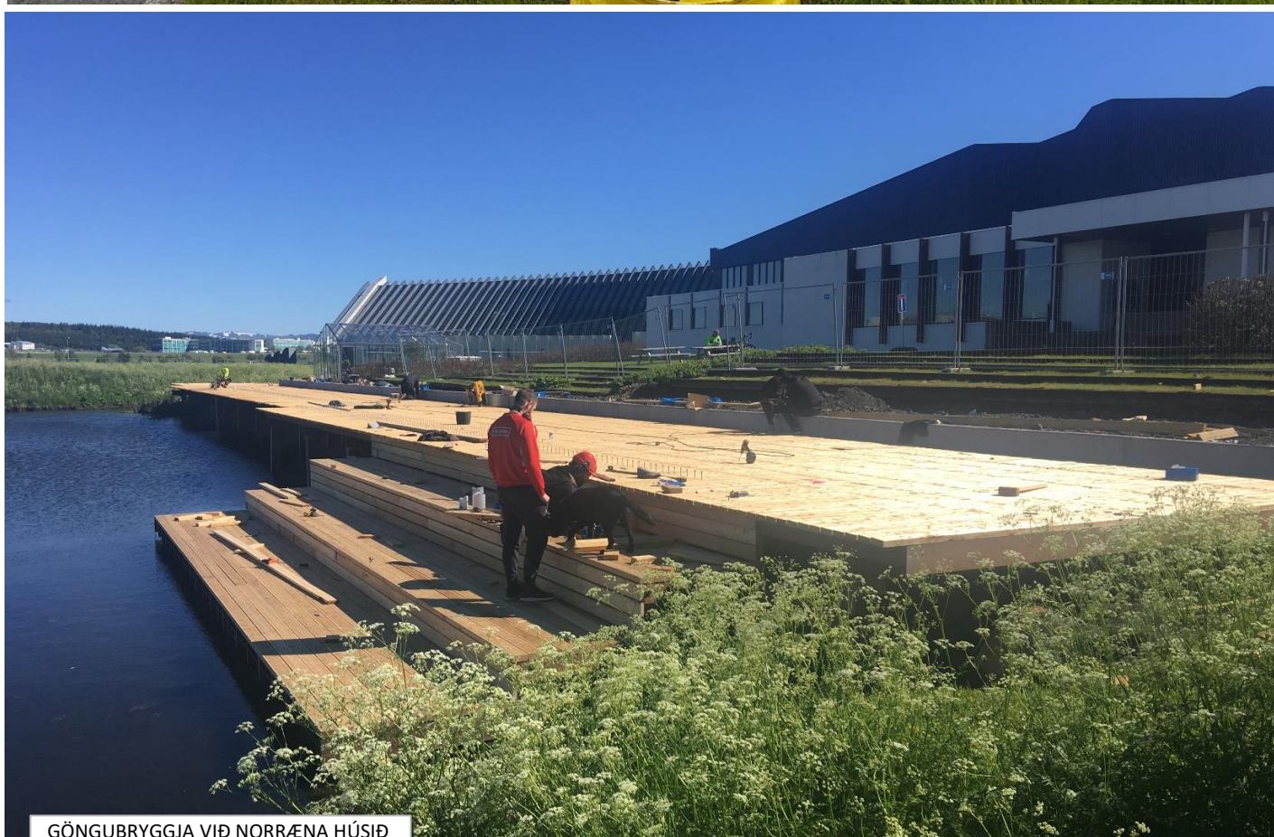
GÖNGUBRYGGJA VIÐ NORRÆNA HÚSIÐ