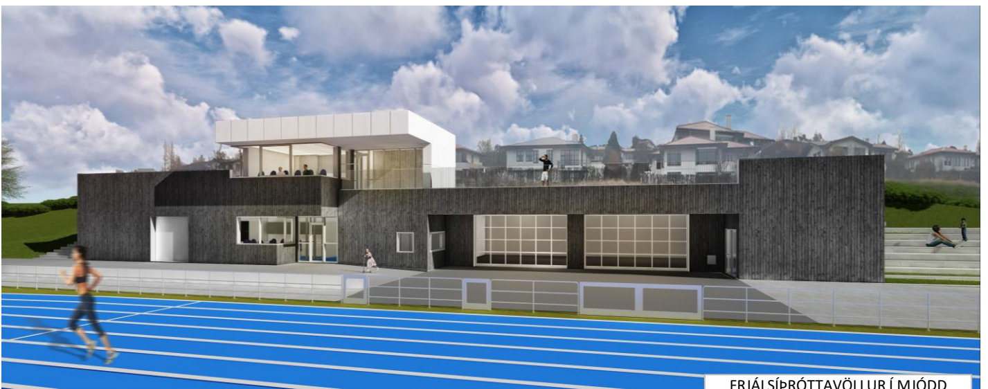
FRJÁLSÍÞRÓTTAVÖLLUR Í MJÓDD