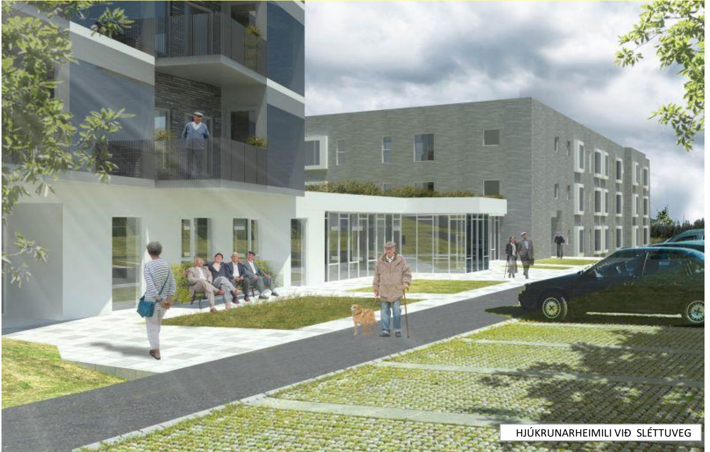
HJÚKRUNARHEIMILI VIÐ SLÉTTUVEG

VERKSTÖÐUSKÝRSLA NÝFRAMKVÆMDA JANÚAR - SEPTEMBER 2018