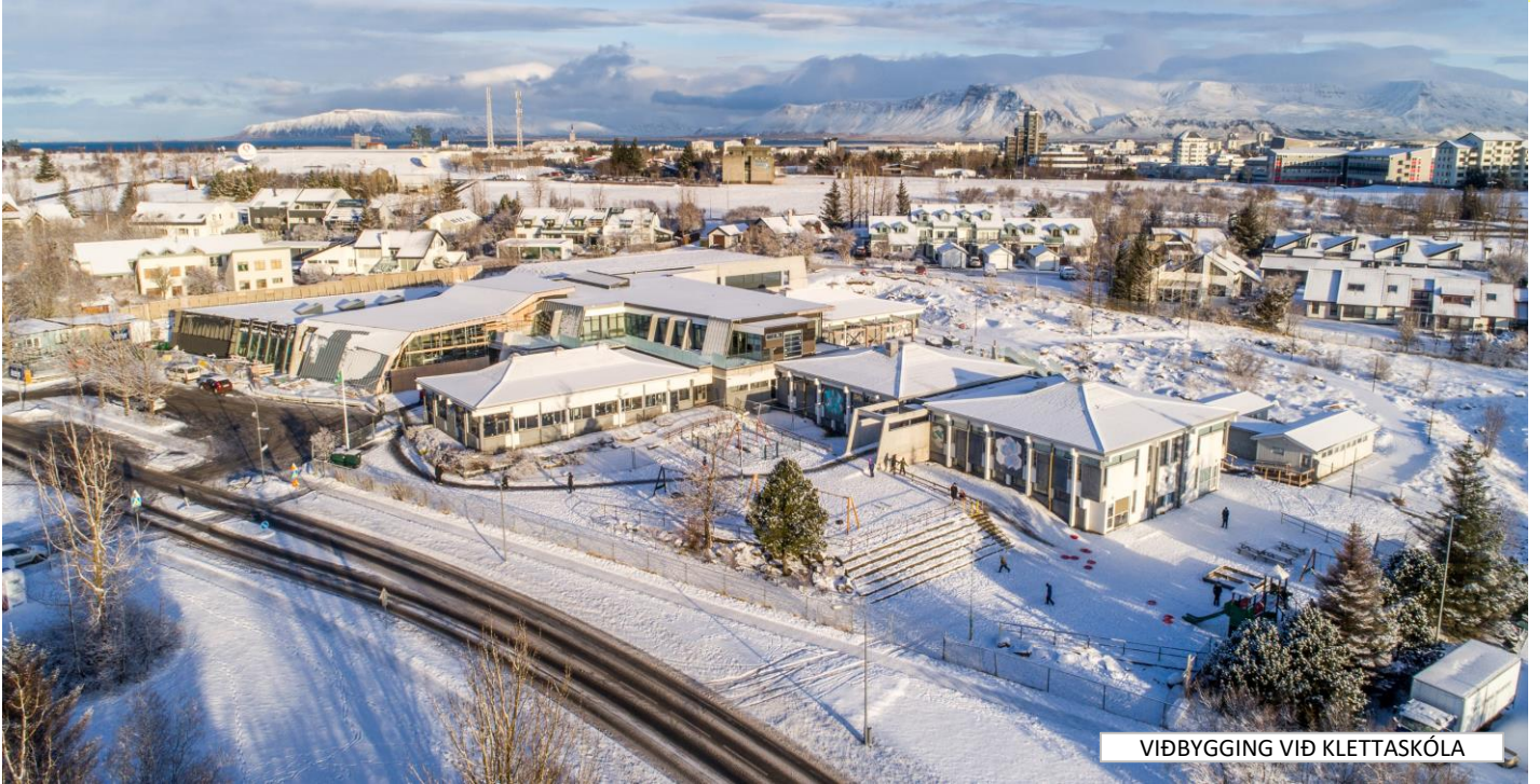
VIÐBYGGING VIÐ KLETTASKÓLA