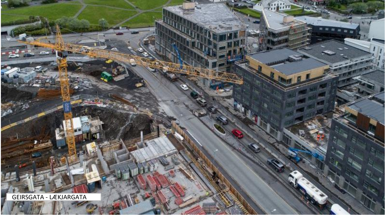
GEIRSGATA - LÆKIARGATA