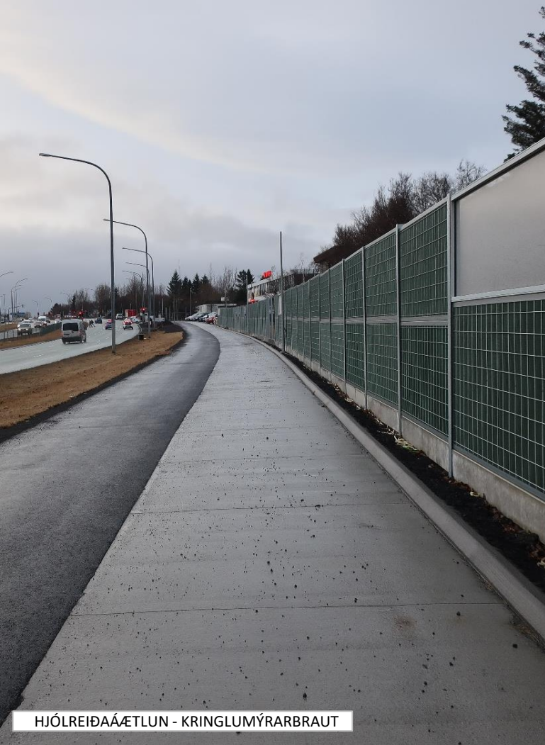
HJÓLREIÐAÁÆTLUN - KRINGLUMÝRARBRAUT