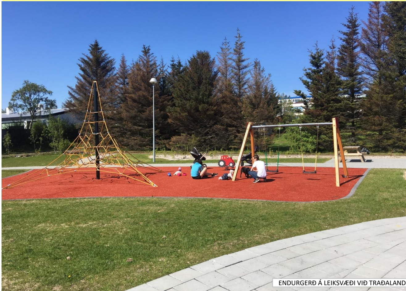
ENDURGERÐ Á LEIKSVÆÐI VIÐ TRADALAND