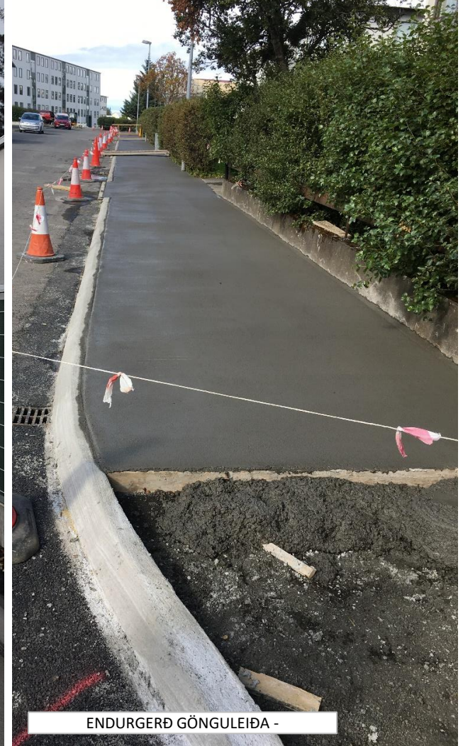
ENDURGERÐ GÖNGULEIÐA -