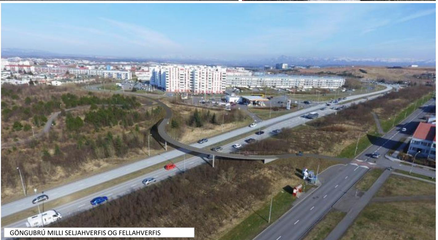
GÖNGUBRÚ MILLI SELJAHVERFIS OG FELLAHVERFIS