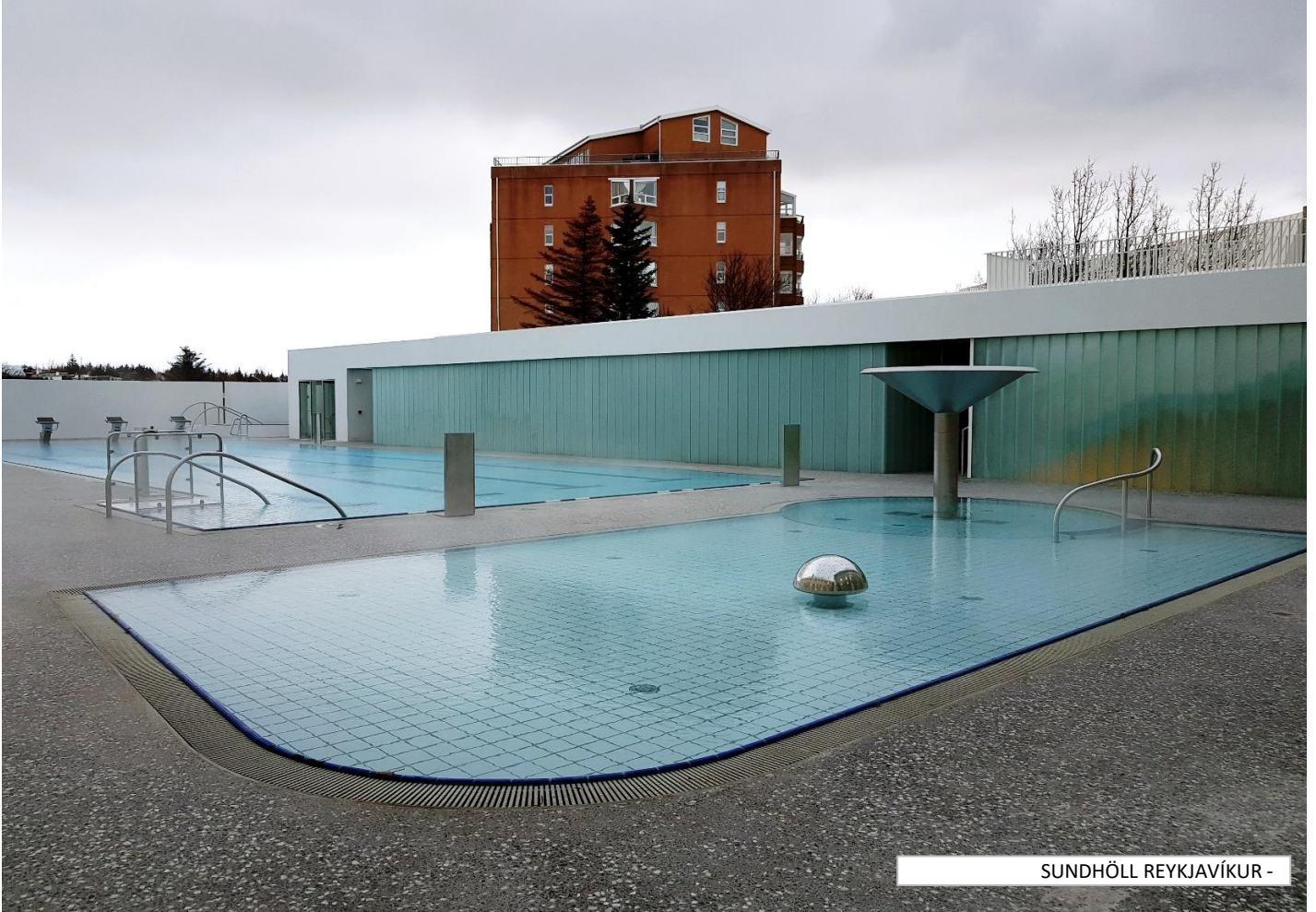
SUNDHÖLL REYKJAVÍKUR -