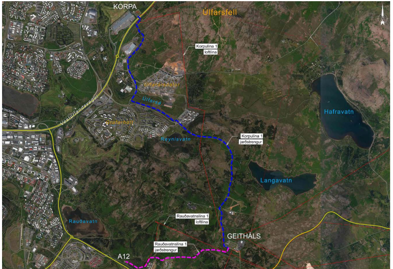
Mynd 1: Áætluð línuleið.

Áætluð línuleið (bláa línan) á mynd 2 sýnir þá tillögu sem aðilar hafa unnið með.