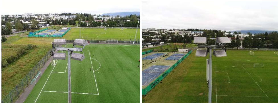
Mynd 4-6: Æfingavöllur Víkings – Núverandi vallarlýsing