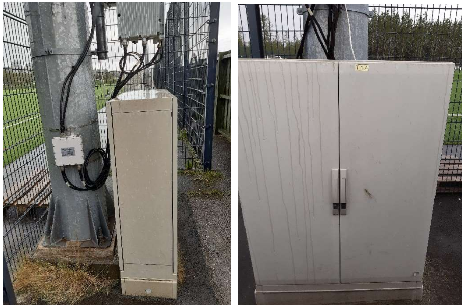
Mynd 1-2: Æfingavöllur Víkings – Núverandi ljósamöstur og tengiskápar

Núverandi vallahlýsing á gervigrasvellingnum er útfærð með lömpum í sex 20m háum kónískum möstrum. Gerð hefur verið sjónskoðun á ástandi mastranna og eru þau í ágætis ásigkomulagi og því ekki talin ástæða til að endurnýja þau.