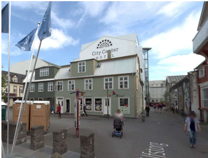
Skjástot af húsinu