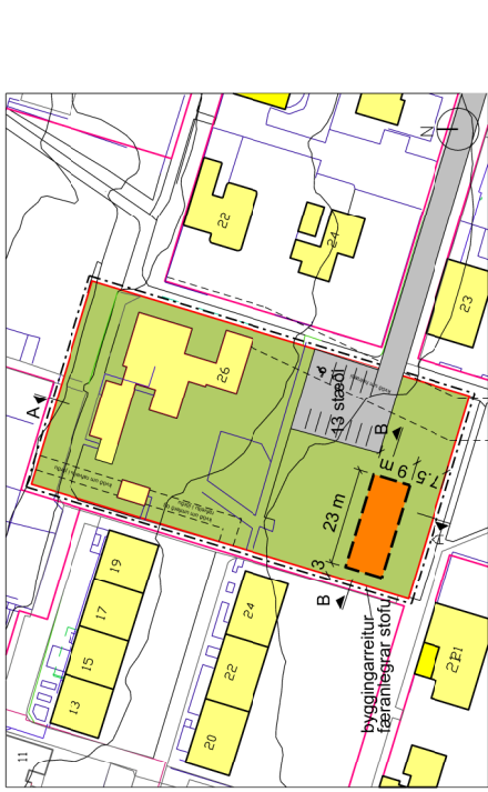
Gildandi deiliskipulagsbreyting samþykkt í borgarráði 15.mai 2011