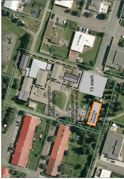
Tilfaga að deiliskipulagsbreytingu Skýringarmynd: Loftmynd mkv. 1:1000