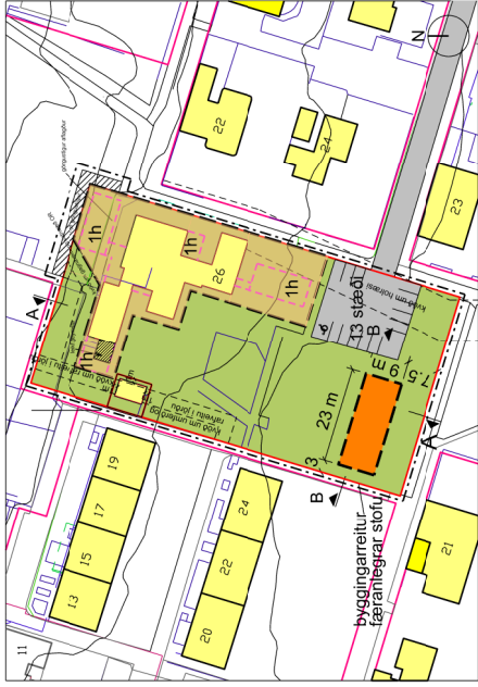
Tilfaga að deiliskipulagsbreytingu mkv. 1:1000

Upphaflegt heildardeiliskipulag fyrir Fossvöggim var samþykkt í borgarráði 6.2.1968, síðan hafa verið samþykktar fjölmargar breytingar á því. Í gildi fyrir löðna er deiliskipulag "Kvistalands 26" samþykkt í borgarráði 15.mai 2011.