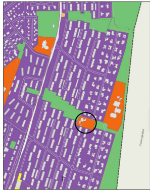
HLUTI AÐALSKIPULAGS REYKJAVÍKUR 2010-2030