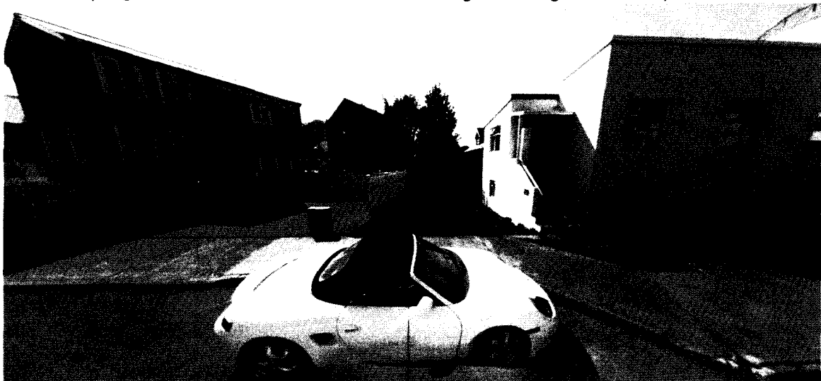
Ljósmynd af vettvangi, tekin í júlí 2019

Embætti skipulagsfulltrúa tekur ekki við læknisvottorðum í tengslum við afgreiðslu erinda / umsókna.