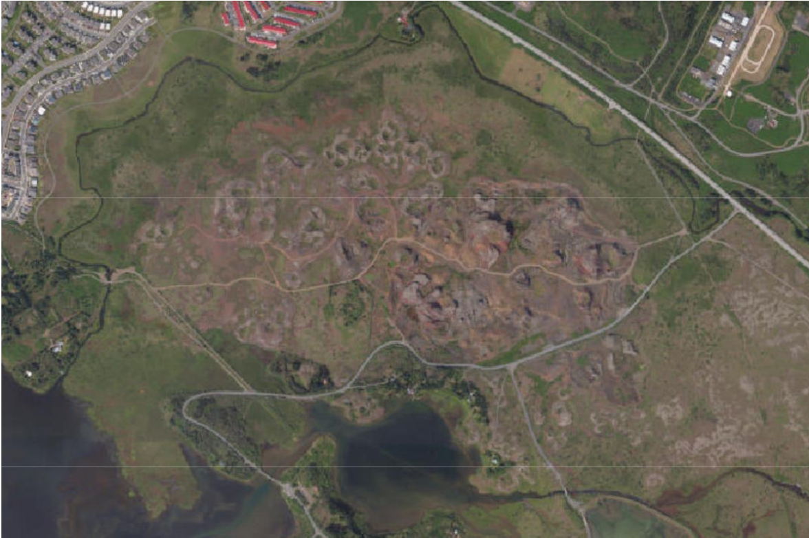
Mynd 2. Afmörkun skipulagssvæðis.