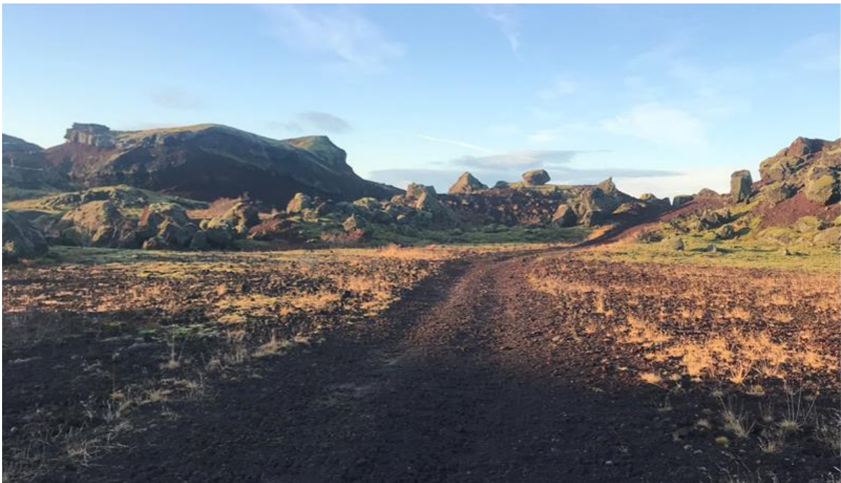
Mynd 1. Rauðhólar.

Samhliða skipulagsvinnunni er Umhverfisstofnun að vinna stjórnunar- og verndaráætlun fyrir Rauðhóla af samstarhópi um fólkvanginn. Áætlunin er hugsuð sem stjórnæki til að móta framtíðarsýn og leggja fram stefnu um verndun fólkvangsins og hvernig viðhalda skuli verndargildi hans.