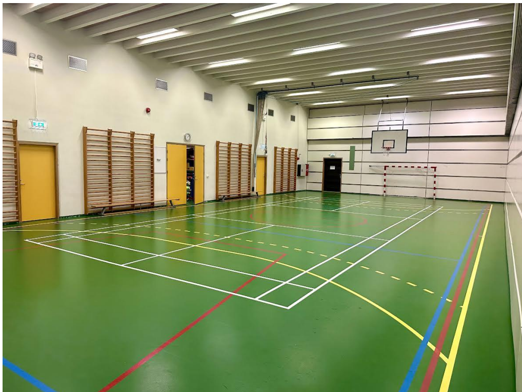
Þetta er íþróttahús Seláaskóla. Staðsett á lóð skólans.

Allir nemendur fara 1x í viku í íþróttatíma. Leikskólinn hefur fengið aðgang að íþróttahúsi Selásskóla tvo daga í viku og fara hópar í aldurskiptum hollum í íþróttatíma með kennurum okkar sem hafa reynslu og áhuga á skipulagðri hreyfingu. Í íþróttahúsinu er fín aðstaða og fáum við afnot af fjölbreyttum efni við er tengist frjálsri hreyfingu, Nemendum þykja íþróttatímarnir mjög eftirsóknarverðir og skemmtilegir.