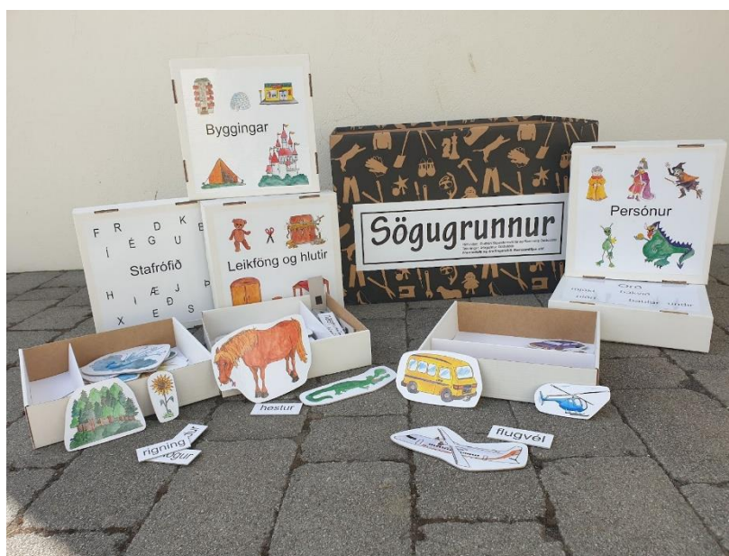
Mynd af sögugrunninum okkar.

Frásagnir eru góð leið til að efla málþroska því það að segja sögu reynir á flesta þætti máls og málnotkunar. Námstækinu Sögugrunni er ætlað að styðja við sögugerð barna og auðvelda kennurum og uppalendum að vinna með og efla málþroska þeirra á markvissan hátt. Námstækið er hjálparhella við sögugerð en býður auk þess upp á marga möguleika til að vinna með tungumálið, skoða uppbyggingu þess og formgerð. Hægt er að kynna sér efnið enn frekar á netinu undir kennsluleiðbeiningar - Sögugrunnur.