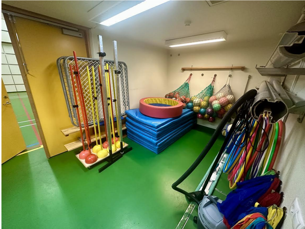
Hér er mynd af áhaldageymslu íþróttahússins og þar er um margt spennandi að velja.