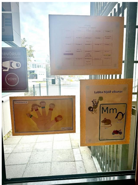
Svona lítur Lubbahjóð vikunnar út, hangir í forstofu leikskólans.