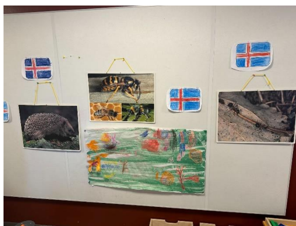
Við heimsóttum tvo leikskóla og fengum virkilega hlýjar móttökur.