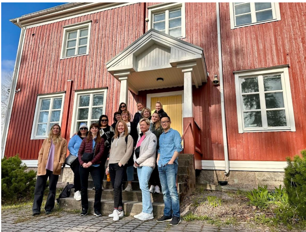
Hópmýnd fyrir utan annan skólann sem við heimsóttum