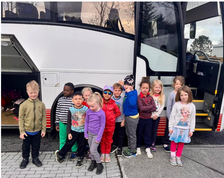
Nemendur í Útskriftarferð í Vatnaskógi 2022

Haldnir voru foreldrafélagsfundir reglulega yfir skólaárið þar sem foreldrar hittust til að ræða leikskólastarfið, gefa hugmyndir, fara yfir stöðuna og ræða hvað er hægt að gera. Sér lokuð Facebook síða er fyrir foreldrafélagið þar sem fundir eru tilkynntir og fleira.