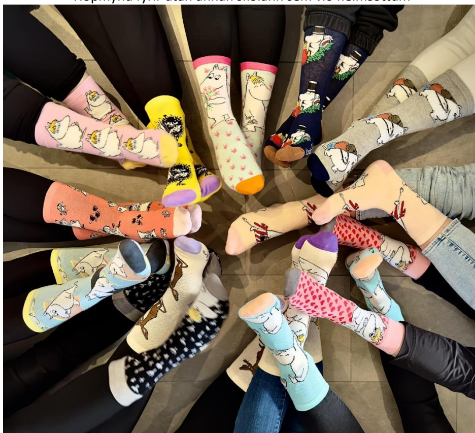
Við tókum þessa dásamlegu mynd af okkur í Múmínsokkum, táknrænt fyrir samstöðu og einnig Finnland.