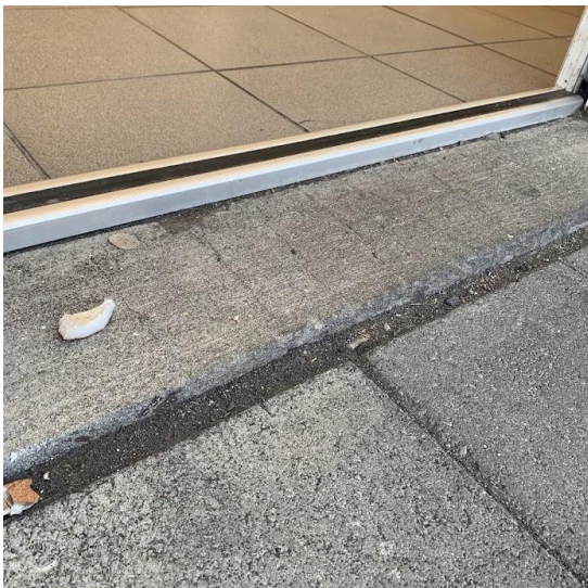
Álrampur en samt töluverð brík