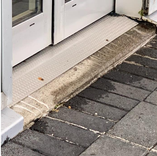
Enginn þröskuldur (til fyrirmyndar)